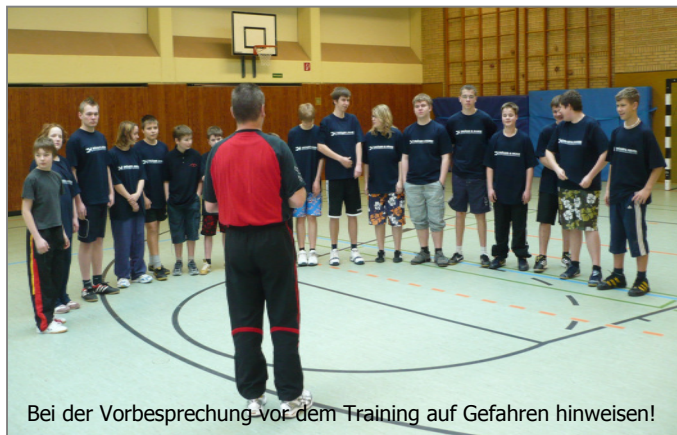
Bei der Vorbereitung vor dem Training auf Gefahren hinweisen!

Wo gehobelt wird, da fallen bekanntlich Späne – und wo Feuerwehrleute gemeinsam Sport treiben, da geschehen leider auch Sportunfälle. Wir wollen mit „Sicher fit!“ helfen, solche unschönen Ereignisse zu vermeiden. In diesem „Stichpunkt Sicherheit“ geht es um Möglichkeiten der Unfallverhütung beim Dienstsport in Turnhallen.